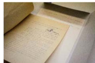
03 Fondos en el Archivo Barragán, detalle