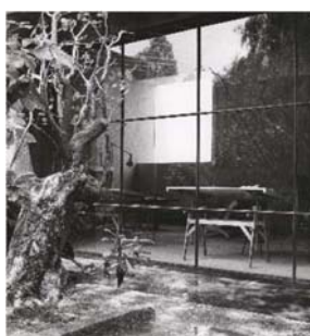
08 Patio interior y ventanal del estudio de Luis Barragán en la Calle Francisco Ramírez 12 (Ciudad de México, 1948), fotografía de Armando Salas Portugal, hacia 1951.