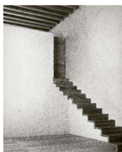
07 Escalera de la biblioteca en la residencia de Luis Barragán en la Calle Francisco Ramírez 14 (Ciudad de México, 1948), fotografía de Armando Salas Portugal, hacia 1951. © Barragan Foundation / VG Bild-Kunst, Bonn 2023