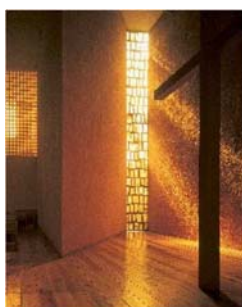
13 Luis Barragán, Capilla del Convento de las Capuchinas en Tlalpan, Ciudad de México, 1954–1963. Cruz independiente en la nave transversal cerca de la vidriera diseñada por Mathias Goeritz