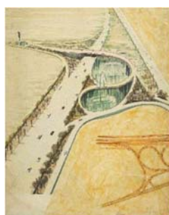
17 Luis Barragán, Las Arboledas, Atizapán de Zaragoza (área metropolitana de Ciudad de México), 1957–1962. Visualización de la salida de la autopista.