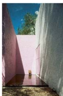
14 Luis Barragán, Casa Gálvez, Ciudad de México, 1955. Fotografía de Armando Salas Portugal de la fuente. © Barragan Foundation / VG Bild-Kunst, Bonn 2023