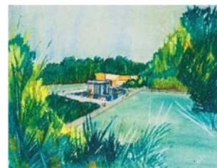
12 Luis Barragán, propuesta para el Parque Azteca, Ciudad de México, 1954 (no realizado). © Barragan Foundation / VG Bild-Kunst, Bonn 2023