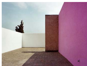
11 La terraza superior de la residencia de Luis Barragán en la Calle Francisco Ramírez 14 (Ciudad de México, 1948), fotografía de Armando Salas Portugal en la década de 1960.