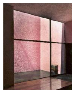
15 Luis Barragán, Casa Gálvez, Ciudad de México, 1955. Vista de la fuente desde la sala, fotografía de Armando Salas Portugal. © Barragan Foundation / VG Bild-Kunst, Bonn 2023