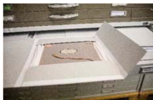
02 Fondos en el Archivo Barragán, detalle © Barragan Foundation, Fotografía: Lake Verea