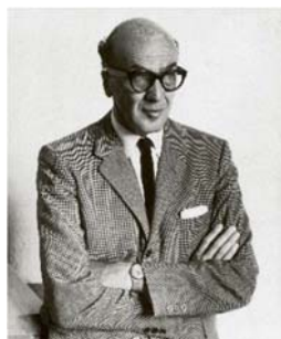
01 Luis Barragán, 1963