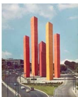
16 Luis Barragán y Mathias Goeritz, Torres de Satélite, Naucalpan de Juárez (área metropolitana de Ciudad de México), 1957. La fotografía de las torres pintada en una paleta de colores naranja y rojo, fue tomada por Armando Salas Portugal a finales de la década de 1960. © Barragan Foundation / VG Bild-Kunst, Bonn 2023