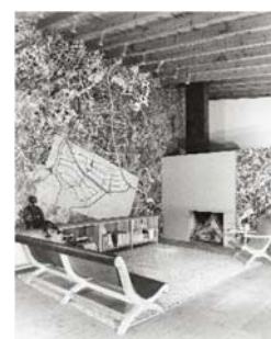
09 Vista interior del estudio de Luis Barragán en la Calle Francisco Ramírez 12 (Ciudad de México, 1948)