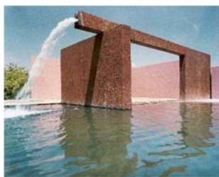
19 Luis Barragán, Los Clubes, Atizapán de Zaragoza (área metropolitana de Ciudad de México), 1961-1966. de la «Fuente de los Amantes».