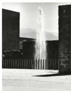
05 Jardines del Pedregal, Ciudad de México (Luis Barragán, 1945--1952). La Plaza de las Fuentes, hacia 1951.