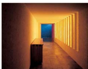
22 Luis Barragán, Casa Gilardi, Ciudad de México, 1975-1977. Vista del pasillo que conduce a la piscina con comedor